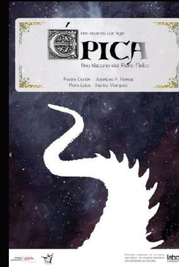
Épica, una historia del Reino Finito (2020)