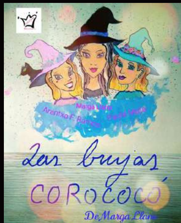
Las brujas Cocorocó (2018)