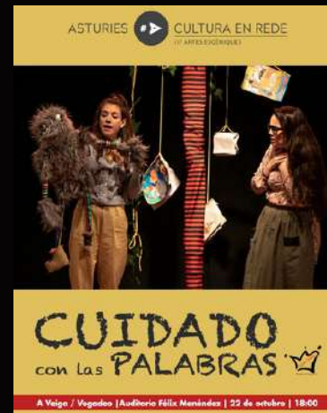
Cuidado con las palabras (2018)