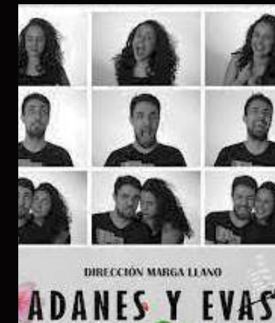
Adanes y Evas (2015)