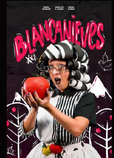
Blancanieves XXI (2019)