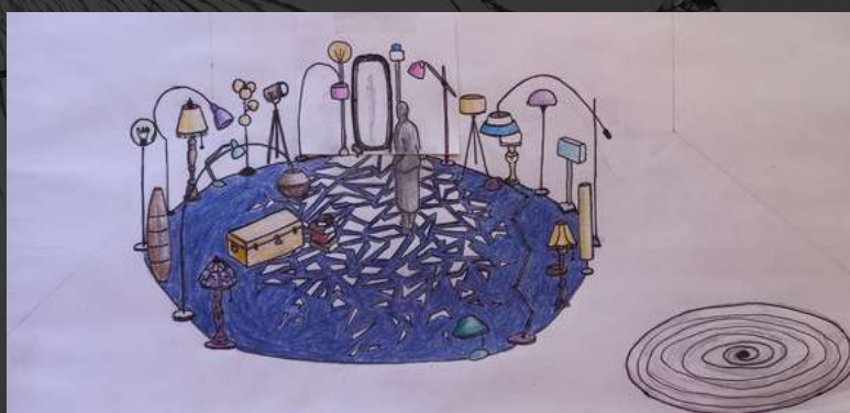
BOCETO ESCENOGRAFÍA "A QUE VOY YO Y LO ENCUENTRO"

Desde el 2009 forma parte de la compañía Beluga Teatro, con la cual ha co-creado y diseñado cuatro montajes para público adolescente. Ha trabajado como diseñadora de escenografía, vestuario e iluminación en Grecia y en España con diversas compañías de teatro y danza como Teatro Municipal de Kavala, Fundación Siglo de Oro, Proyecto 43-2, Teatro en Vilo, Centro Dramático Nacional, Zukdance Performing Arts y Teatro la Abadía, entre otras. Especialista en creación de máscaras profesionales para teatro, imparte talleres en la Escuela Internacional del Gesto.