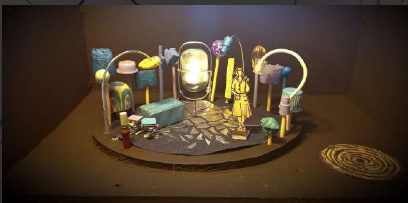
MAQUETA ESCENOGRAFÍA "A QUE VOY YO Y LO ENCUENTRO"