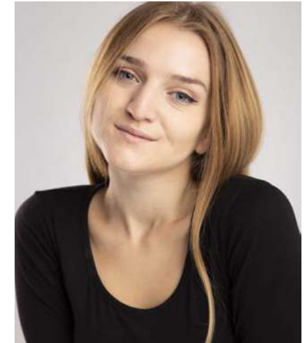
IVIYANA DONCHEVA PRINCESS